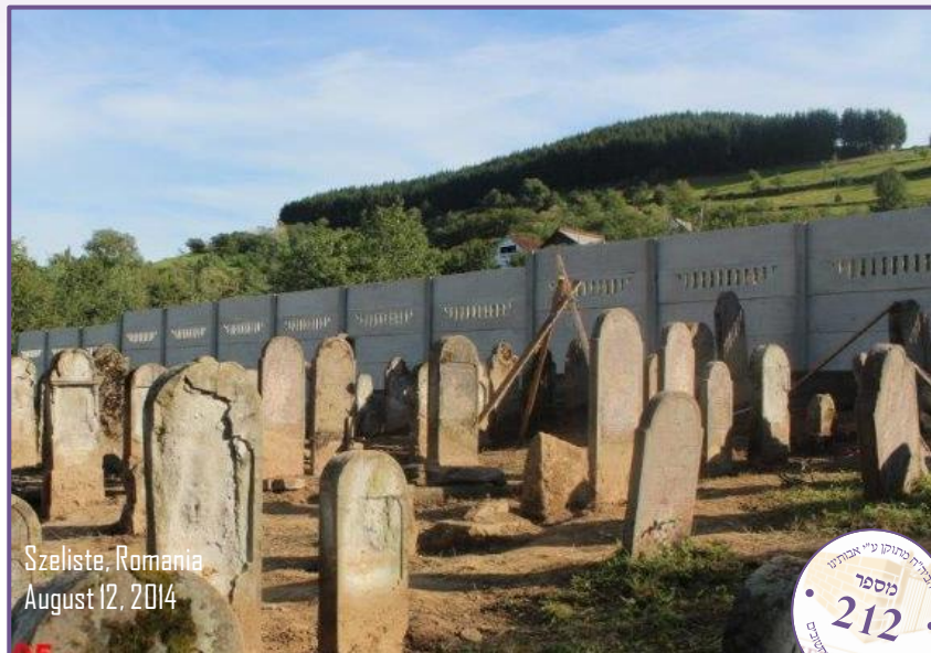
Szeliste, Romania August 12, 2014